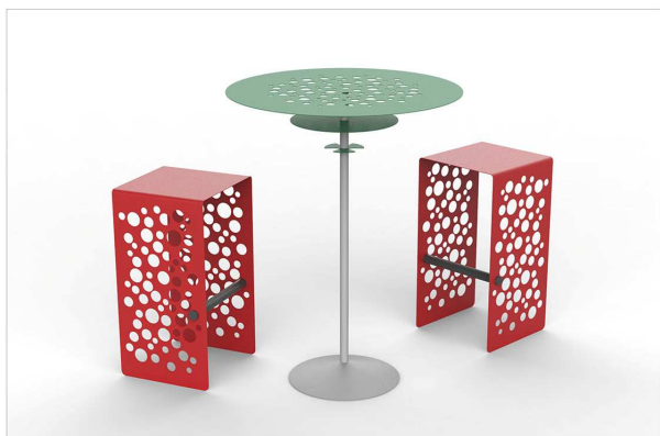
TAVOLINO H105 mod.1120

- dimensions: mm 800x800x1050; shelf 368 mm; bag holder 136 mm total weight kg. - dimensions: mm 800x800x750; shelf 368 mm; bag holder 136 mm total weight kg.