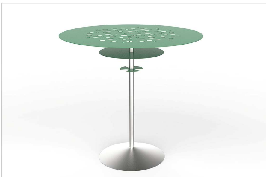
TAVOLINO H75 mod. 1120